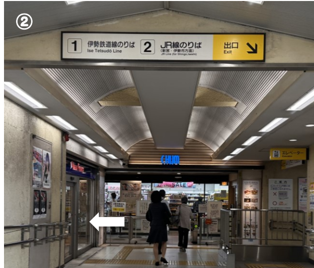
②東改札口を出たら左に曲がります。正面にマツモトキヨシ、左側にパン屋さんがあります。このフロアには食べ物屋さんがあります。