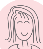
保護者会会長 Gさん

「読み合わせの会をオンラインで開催中。感想を出しあうことはもちろん、さまざまな悩みも語りあうことができた」