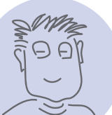
連絡協議会会長 Fさん

「本誌モニターになった保護者の方から、『係として引き受けたのがきっかけだったが、学童保育の大切さを知ることができてよかった』と言ってもらえた」