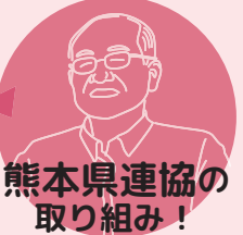
熊本県連協の 取り組み！

ほいく誌への関心・普及拡大の取り組みとして、子どものイラスト投稿を呼びかけています。放課後児童支援員認定資格研修でもほいく誌の紹介しています！