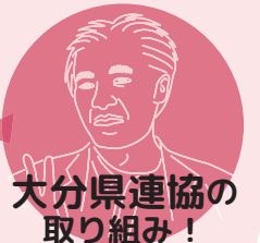
大分県連協の 取り組み！

ほいく誌への関心・普及拡大の取り組みとして、子どものイラスト投稿を呼びかけています。放課後児童支援員認定資格研修でもほいく誌の紹介しています！