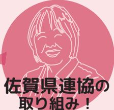
佐賀県連協の 取り組み！

ほいく誌の読み合わせ会を、月に2回実施！ おやつレシピーや、あそびなど、学童保育で活用できる、記事を紹介。唐津市では保護者を含めた全員購読が実現しました！