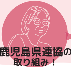
鹿児島県連協の 取り組み！

連絡協議会の加盟数を増やし、学童保育運動を支えるほいく誌の全世帯購読を推進！ “特別な何か”ではなく、指導員や保護者の日常会話に、あたりまえのように『日本の学童ほいく』がある！