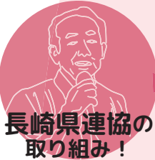
長崎県連協の 取り組み！

ほいく誌の普及拡大ニュース「みてみんな」を発行！ 新旧モニター会議の開催。県の研究集会でも、ほいく誌のアピールタイムを企画中です！