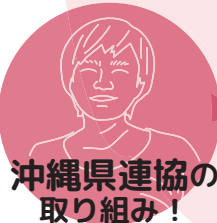
沖縄県連協の 取り組み！

2008年7月号の36部から、2023年7月号は182部へ、購読数が拡大してる。2019年、中津市連協設立。日田市の指導員が執筆した2021年4月号を県の研究集会で見本誌として配布！