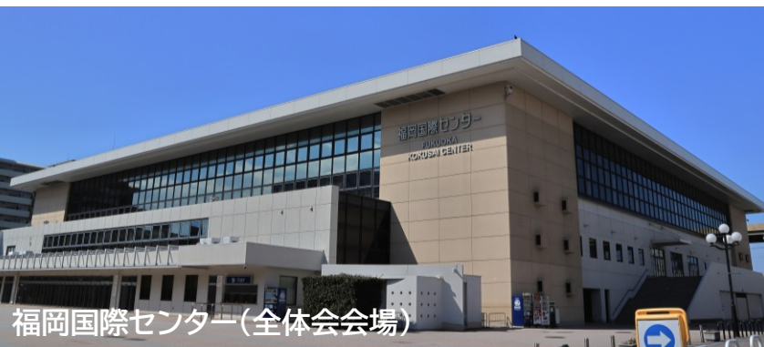
福岡国際センター(全体会会場)